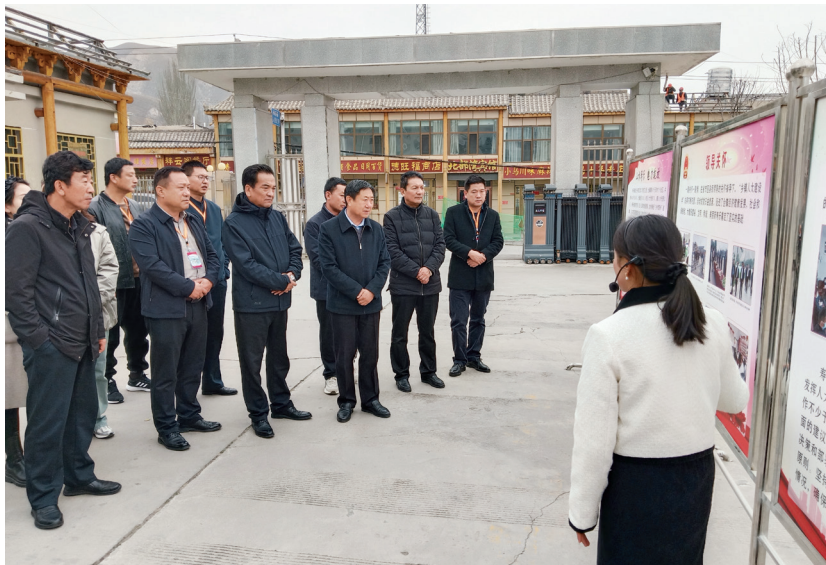
海东市人大常委会举办代表培训。图为实地视察乐都区寿乐镇代表工作。

持。二是做好规范代表履职工作。建立健全代表履职评价和激励、退出和增补等机制，对部分履职意识不强、能力不足的市人大专门委员会委员进行调整，及时补充新鲜血液。本届以来，累计调整29人。推进代表履职档案规范化建设，对代表参加会议、提出建议、参加调研视察和执法检查活动、联系选民等履职情况进行详细记录，作为代表考核评价的重要依据。加强代表履职经费保障，对无固定收入的人大代表参加代表活动时，按相关规定和标准给予误工补贴，有效增强了代表履职的积极性。三是探索拓展代表履职领域。不断探索全过程人民民主的新路径和人大代表参与社会治理的新方式，开展“人大代表+信访调解”活动。向全市各级人大代表发出倡议，动员和组织代表多渠道收集社情民意，常态化开展“线上+线下”选民接待活动，当好矛盾纠纷化解一线的“调解员”“智囊团”和“攻坚手”，使“人民选我当代表，我当代表为人民”的承诺真正落实为推动基层治理的实际效能。本届以来，各级人大代表累计接待选民9357人次，解决实际问题1400余项。四是全面展示代表履职风采。引导和支持各级各部门大力挖掘和宣传人大代表的履职事迹，讲好履职故事，激励各级人大代表积极投身中国式现代化海东实践。本届以来，对来自各行各业的130余名优秀人大代表先进事迹进行了广泛宣传，其中92名人大代表履职风采入选《全省百名人大代表履职故事》，发挥示范引领作用，激发代表履职热情。