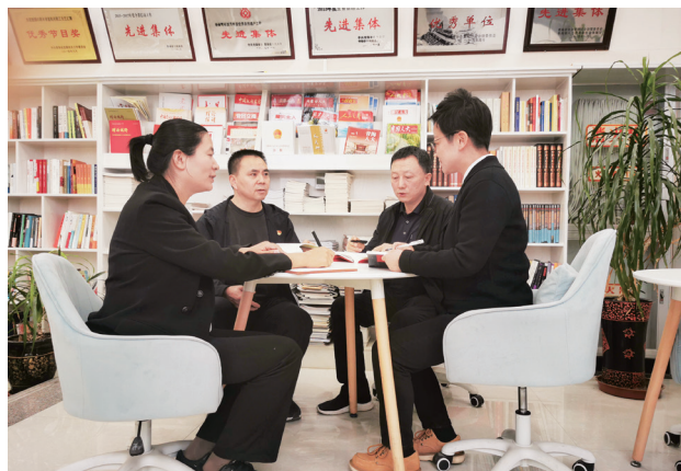
省人大监察司法委党支部组织开展“书香润心,悦享经典”主题党日活动。

任王黎明和省人大常委会党组副书记、副主任尼玛卓玛赴省司法厅、省公安厅、省国家安全厅走访调研,结合党纪学习教育走访问需、征求工作建议,真正做到调研与检视、征求意见与梳理问题、整改落实与自查自评紧密结合,确保党纪学习教育落地见效。深入推进作风突出问题专项整治,专题安排部署赊账消费、违规收送礼品礼金等专项整治工作,全体党员、干部深刻检视自身偏差,认真撰写个人自查自纠报告,作出坚决不收送礼品礼金的承诺。2025年,紧密结合深入贯彻中央八项规定精神学习教育重点作了以下三方面工作:一是