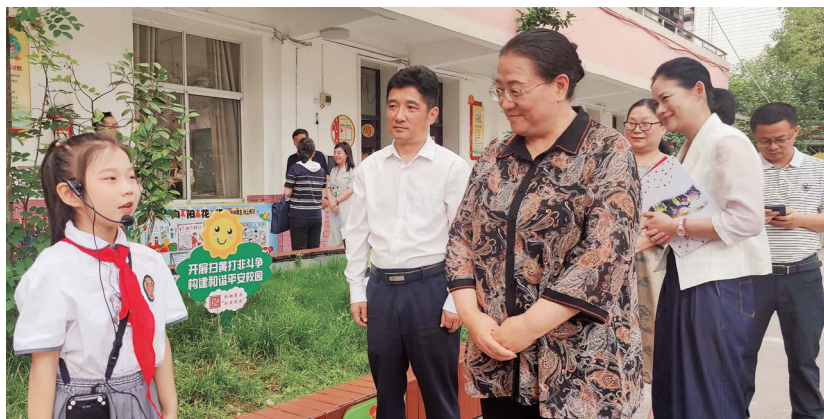
省人大常委会党组副书记、副主任尼玛卓玛带队赴湖北省开展家庭教育促进立法调研。

条例明确了家庭暴力的三种主要类型——身体暴力、精神暴力、性暴力，细化了具体表现形式，包括殴打、捆绑、冻饿等身体伤害行为，禁闭、限制交往等限制人身自由行为，以及恐吓、跟踪、经常性谩骂、漠视、孤立等精神侵害行为，通过网络实施的相关侵害行为也纳入其中。这一界定精准回应了现实中家庭暴力形式多样化、隐蔽化的特点，让更多受害者能够依法