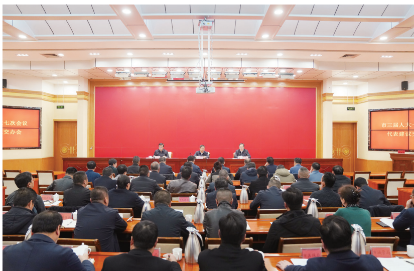
2月27日，海东市人大常委会召开市三届人大七次会议代表建议交办会，安排部署人大代表建议办理工作。

是提升代表履职能力水平。坚持把代表履职培训作为加强和改进代表工作的重要基础，在培训安排上，广泛征求各级代表的意见，针对新进代表、连任代表以及不同领域代表的履职需求设计培训内容，确保培训对象、培训需求、培训内容有机衔接；在培训方式上，采取“线