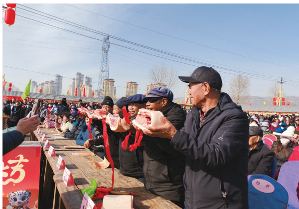
大堡子地区“三乡邻聚里”年俗年货节一角。