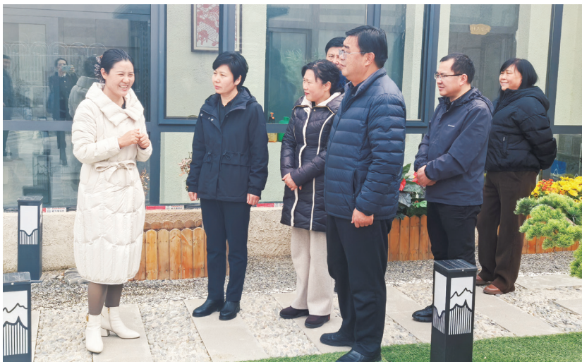
省人大常委会法工委在贵德县家教家风教育实践基地开展《青海省家庭教育促进条例（草案修改稿）》立法调研。