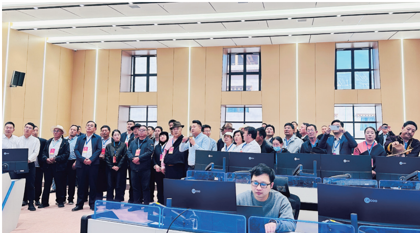
同仁市五级人大代表视察全市“智慧城市”建设。

选民督办，以实事映初心。线上线下载发力，通过网络媒体、公示栏将人大代表信息、联系机制等进行公开，人大常委会主要领导带头开展接访活动，自上而下引导群众积极参与、同步监督。建立“主动接访—选民监督—意见办理—督办反馈”闭环服务模式，推动代表履职尽责，2025年来，已解决群众诉求30余条、梳理发展建议10余条。