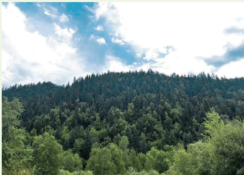
寺沟管护站里的郁郁葱葱。

多年来，门源县以国土绿化行动为依托，综合推进多项绿化工程，极大改善了全县生态环境。东川镇蘑菇掌国土绿化项目就是其中之一。“2010年起至2022年，我县通过实施青海湖流域周边地区生态环境综合治理等项目在蘑菇掌完成造林3500余亩（约233.45公顷），种植了青海云杉、金露梅、