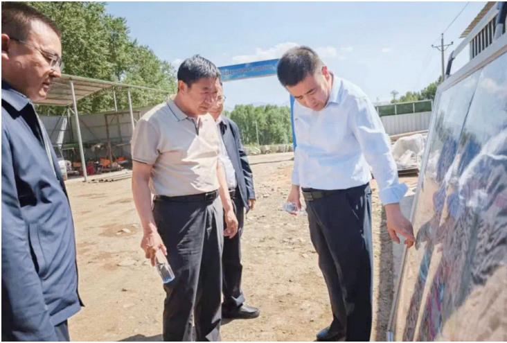
5月28日，海东市人大常委会赴乐都区调研督导杨家水厂及输配水管网工程。