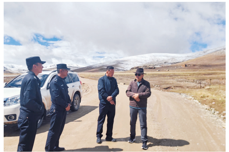
6月5日，治多县人大常委会深入加吉博洛镇日青村虫草采集管理卡点，督导检查虫草采集期服务管理工作。