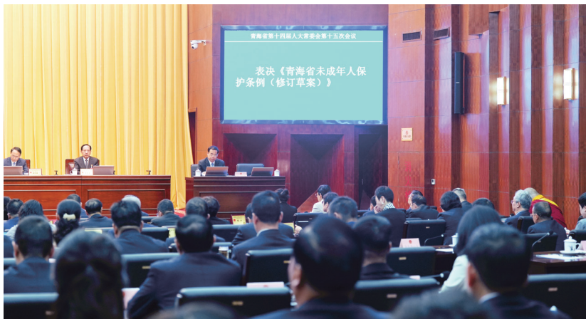
《青海省未成年人保护条例》审议通过。