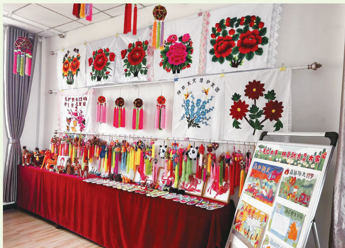
老虎沟管护站生态文明宣传教育室里的生态文创作品。

在门源县仙米乡桥滩村有我省首个以国家公园为主题的自然类科普馆——祁连山国家公园生态科普馆。生态科普馆的工作人员介绍，馆内设“巍巍祁连”“中国湿岛”“多