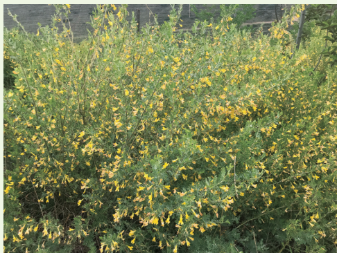
吴仲山绿化区中开黄花的柠条。

在青海省三江集团北山绿化区矗立的两块“责任碑”，像是述说着30多年绿化责任“接力棒”传递的故事。1989年，原省商业厅按照省委、省政府的统一规划，承包了北山林家崖绿化区。由于机构改革，1998年省贸易厅(前身为商业厅)撤销，原来的行政部门承担的绿化责任，归省商贸资产经营公司管理。2003年该公司与原青海农牧控股公司合并成立省三江集团公司，三江集团作为牵头单位全面负责绿化区各项工作。30多年来通过绿化区各成员单位的共同努力，投入大