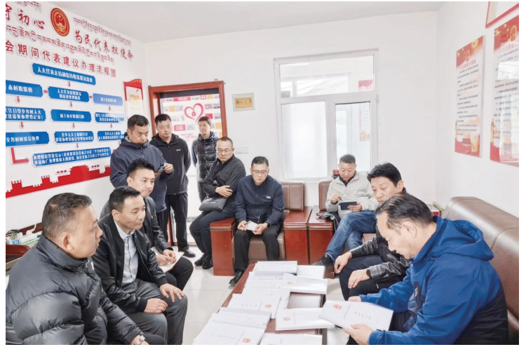
5月26日，果洛州人大常委会赴班玛县开展综合调研工作。