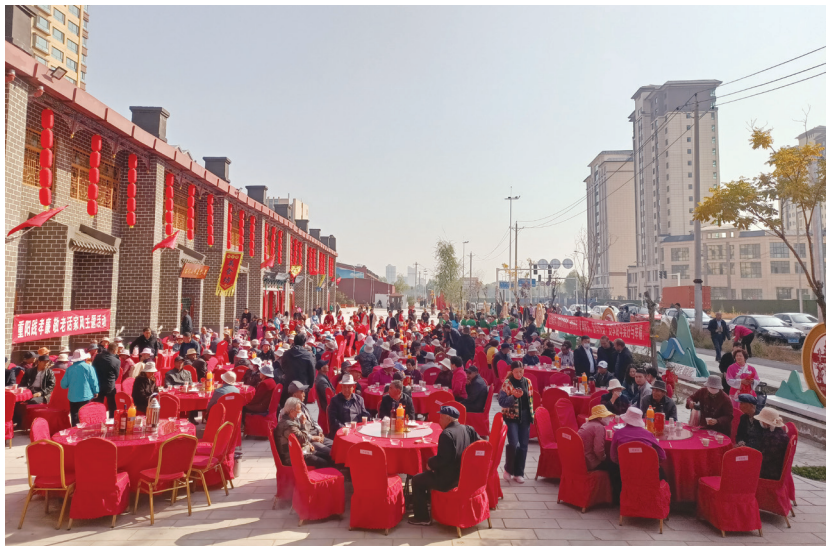
陶北村举办“重阳践孝廉 敬老话家风”主题活动。