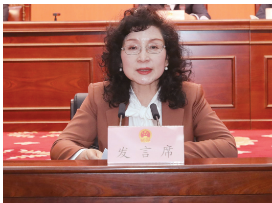
省人大民侨外委副主任委员

坚持示范引领，强化担当作为，确保踏实勤劳干事。 破除错误思想的关键在于行动转化，以真抓实干的工作作风，勇于担当作为，踏实干事、勤劳干事。要全面贯彻落实党的二十大、党的二十届三中全会、省委十四届历次全会精神，以学习教育为契机，结合省人大民侨外委工作，以铸牢中华民族共同体意识为主线，顺应时代发展要求，全面检视民族宗教领域法治建设方面的问题短板，有序推进涉民族宗教事务相关法规的健全完善工作，并加强侨务、外事等领域的立法研究和实践。探索将符合民族自治地方实际、经过长期实践检验，有利于铸牢中华民族共同体意识的