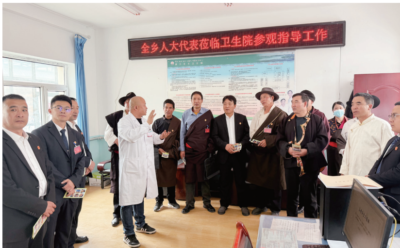
黄乃亥乡人大主席团组织市乡人大代表调研乡镇卫生院工作。