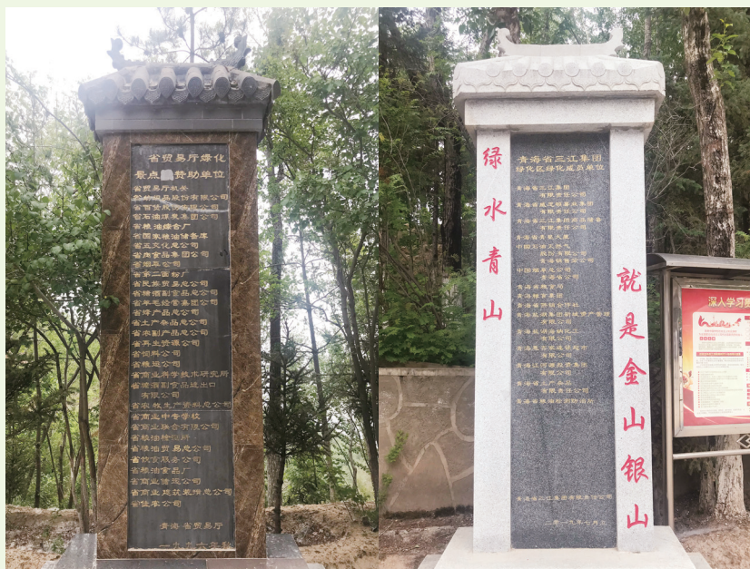
青海省三江集团北山绿化区矗立的两块“责任碑”，变换的单位名称，不变的绿化责任，30多年的“接力棒”始终传递。