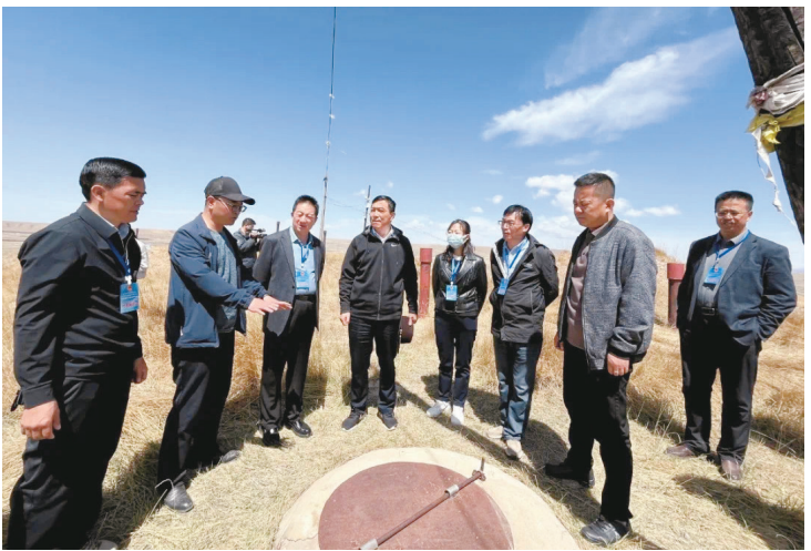
5月15日，刚察县人大常委会对全县贯彻实施《海北藏族自治州生态环境保护与修复条例》情况进行执法检查。