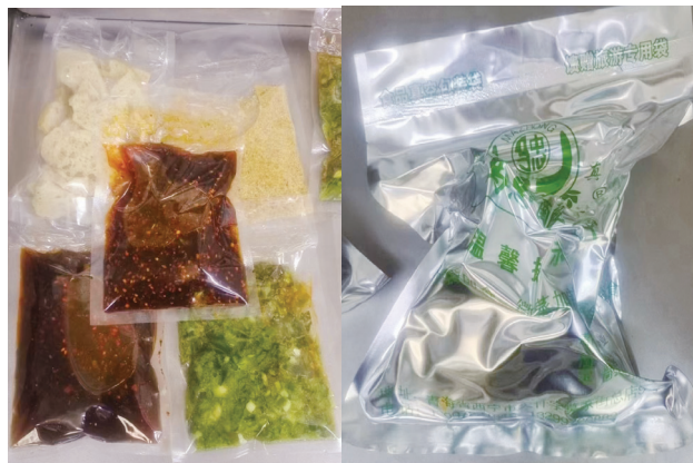
新研发酿皮真空包装。

整人员的培训和认证，通过制定相关的培训和认证标准，提高专业人员的技能水平和职业素养，从而更好地为残疾人提供适配服务；加大政府对智能辅助器具的投入力度，提高残疾人适配辅具的标准，使得