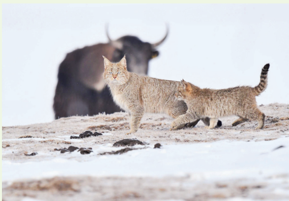
管护员在老虎沟拍到的荒漠猫。