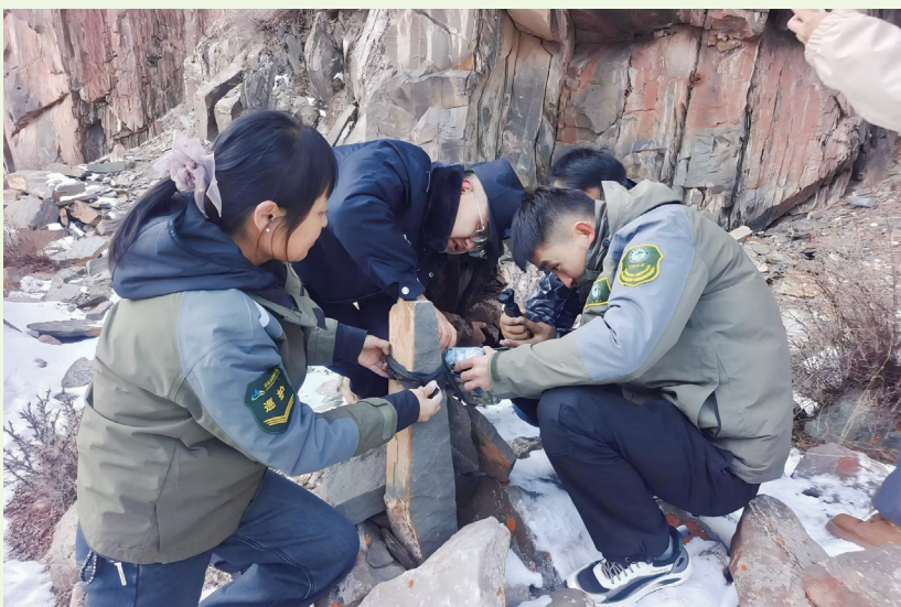
老虎沟管护站管护员与公安干警维护设施。

多为小企业、应对外部环境能力低、产品市场化程度不高、产业链协同和互补效应弱等问题。”海北州人民政府有关负责人表示。