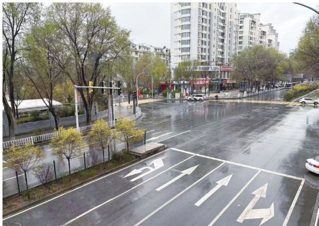
创新设置“会发光的斑马线”。