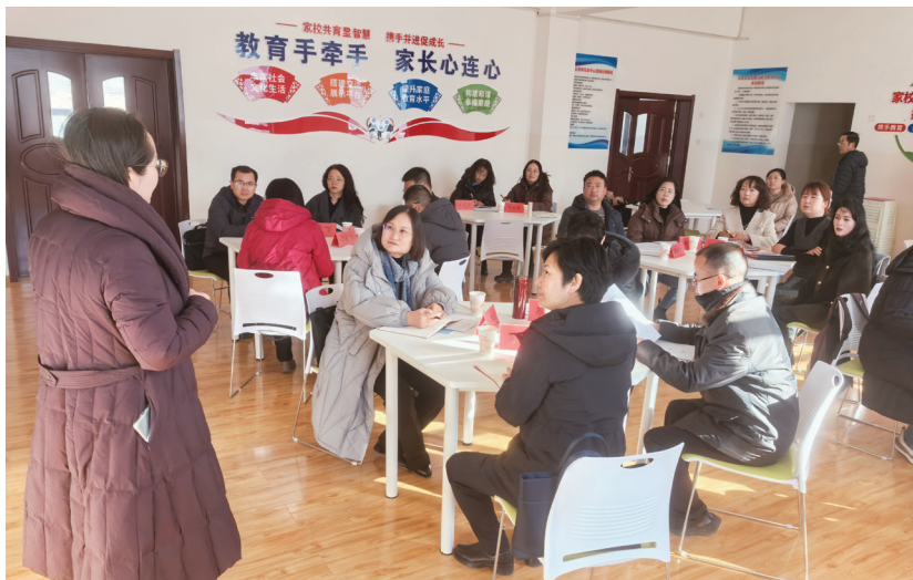
省人大常委会法工委在西宁市湟源县家庭教育指导中心开展《青海省家庭教育促进条例（草案修改稿）》立法调研。

家庭是人生的第一个课堂，父母是孩子的第一任老师。父母或者其他监护人应当依法承担对未成