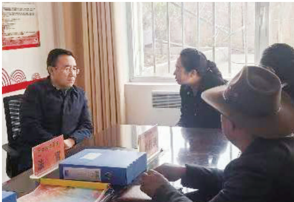
海南州人大常委会赴贵德县开展人大工作调研。

全国人大代表毕生龙的履职笔记本上密密麻麻写满了田间地头的民情。在“村企联营”的蔬菜加工车间，他与工人深入交流，认真记录他们关于技能培训的需求和期望，了解到工人渴望学习更先进的加工技术以提高工作效率和产品质量的诉求。围着牧民的炉灶，他耐心倾听牧民心声，梳理出“有机肥补贴”政策在实际执行过程中的盲点，如补贴标准不够明确、申请流程较为烦琐等问题。2025 年带上全国人代会的《关于农牧循环产业扶持建议》是他经过 28 次村民夜谈会、广泛收集群众意见、深入分析农牧区产业发展现状后形成的。这