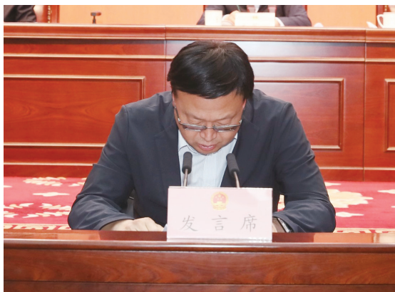
省人大常委会办公厅副主任

“学”既要学习习近平总书记关于加强党的作风建设的重要论述等规定篇目，学出改进作风、推动工作的坚定信念和思路举措；也要坚持强化警示教育，通过典型案例的学