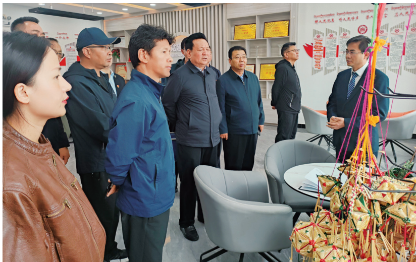
兴海县人大常委会视察子科滩镇安多民俗社区人大代表活动室。