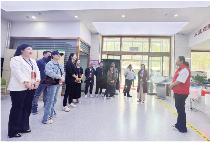
6月10日，西宁市城中区人大常委会组织部分市、区人大代表调研全区“银发经济”发展情况。