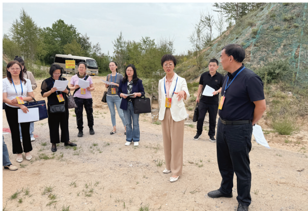
城西区人大常委会组织人大代表对防灾减灾提升工程项目进行视察。