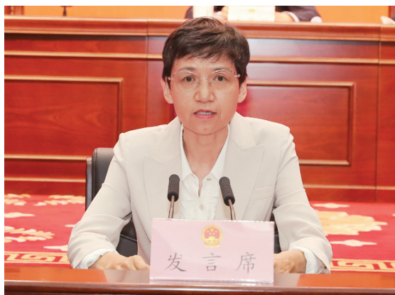
省人大农牧委主任委员

重要讲话精神结合起来，与学习涉农法律法规及推动工作结合起来，聚焦年度工作任务，积极践行全过程人民民主，以谋事干事的状态、务实高效的作风，把学习成果转化为推动人大农牧工作高质量发展的实际成效。以勤劳干事锤炼过硬作风。加强“三农”领域立法，以钉钉子精神夯实“三农”法治根基。运用好宪法法律赋予人大的监督权，扎实开展《青海省实施河长制湖长制条例》执法检查，把情况摸透、把问题找准、把建议提实，结合省人大常委会会议审议意见，督促政府及相关部门抓好整改落实。持续拓展“人大代表进乡村”活动，充分发挥委员和专业代表小组成员的业务专长，不断凝聚民意民智，在推动我省农业增效益、农村