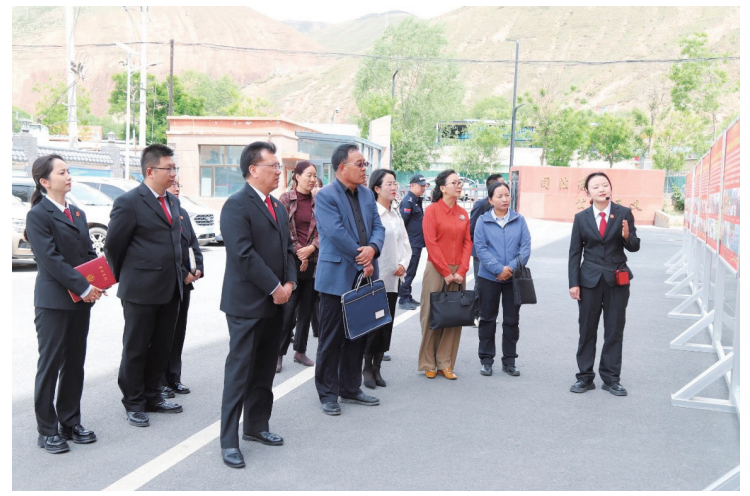
5月27日，同仁市人大常委会赴市中级人民法院专题调研市中级人民法院助力打造法治化营商环境情况。